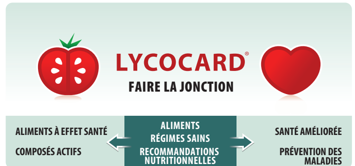
Figure 1: Les résultats de LYCOCARD permettront de faire la jonction